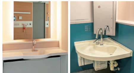
長野県 国立大学附属病院 東京都庁第二庁舎