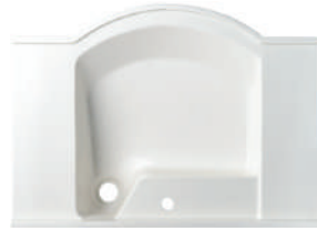
UNIBERSAL DESIGN Universal bowl - straight type