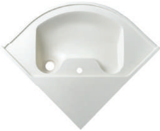
UNIBERSAL DESIGN Universal Bowl - Corner Type